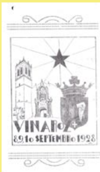
Portada del llibre del congrés

l'anomenada "dictablanda" del general Berenguer, a poc a poc KEF va reprendre la seva activitat normal, sota la direcció dels antics membres, l'estiu del mateix any, declarant no oficials les activitats de la junta anterior. En el primer número de KE es declarava no reconèixer les revistes publicades per la KEF de HEA i el número de juliol de 1930 parlava ja obertament de les "vergonyoses circumstàncies que ha viscut la nostra nació els sis darrers anys".