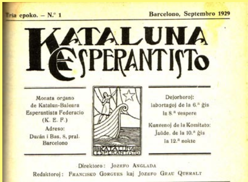
Capçalera de la revista Kataluna Esperantisto editada per la Federació Catalano-Balear

El congrés de Vinaròs de 1928 és, fins avui, l'únic congrés català celebrat al País Valencià