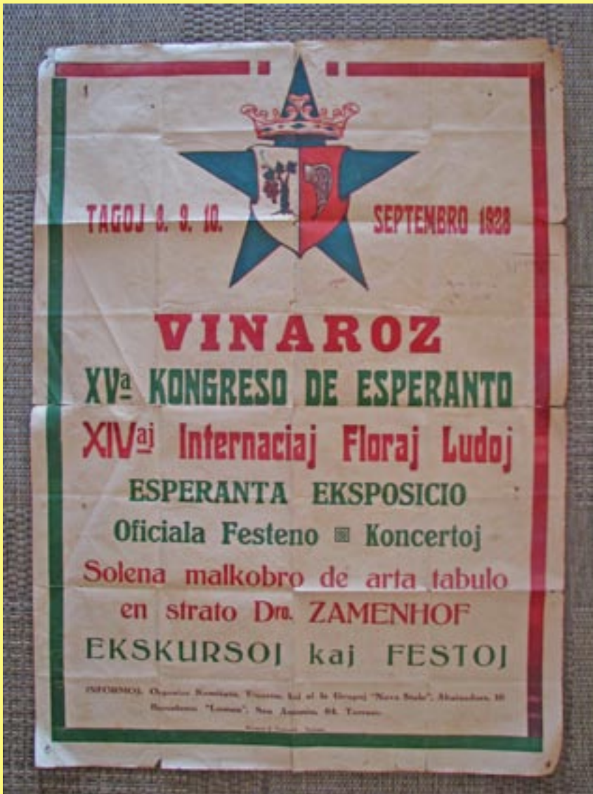
Cartell del congrés. En aquest cas és, curiosament, el que es va rebre per correu a la seu de l'associació Nova Sento del Poble Nou.